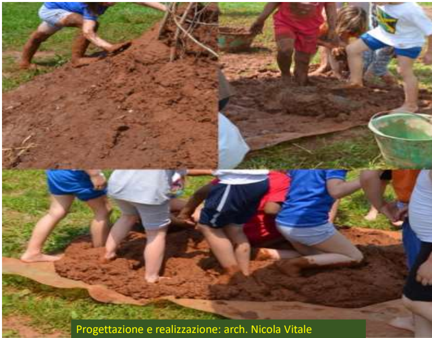
Progettazione e realizzazione: arch. Nicola Vitale Consulenza pedagogica: dott.ssa Cristina Bertazzoni