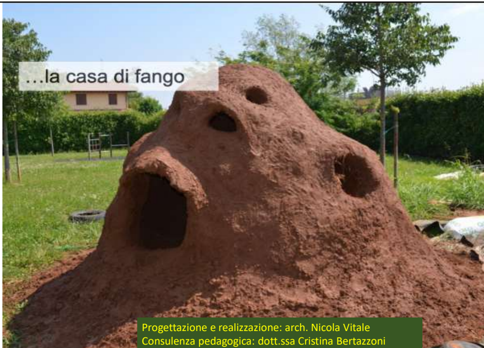
...la casa di fango