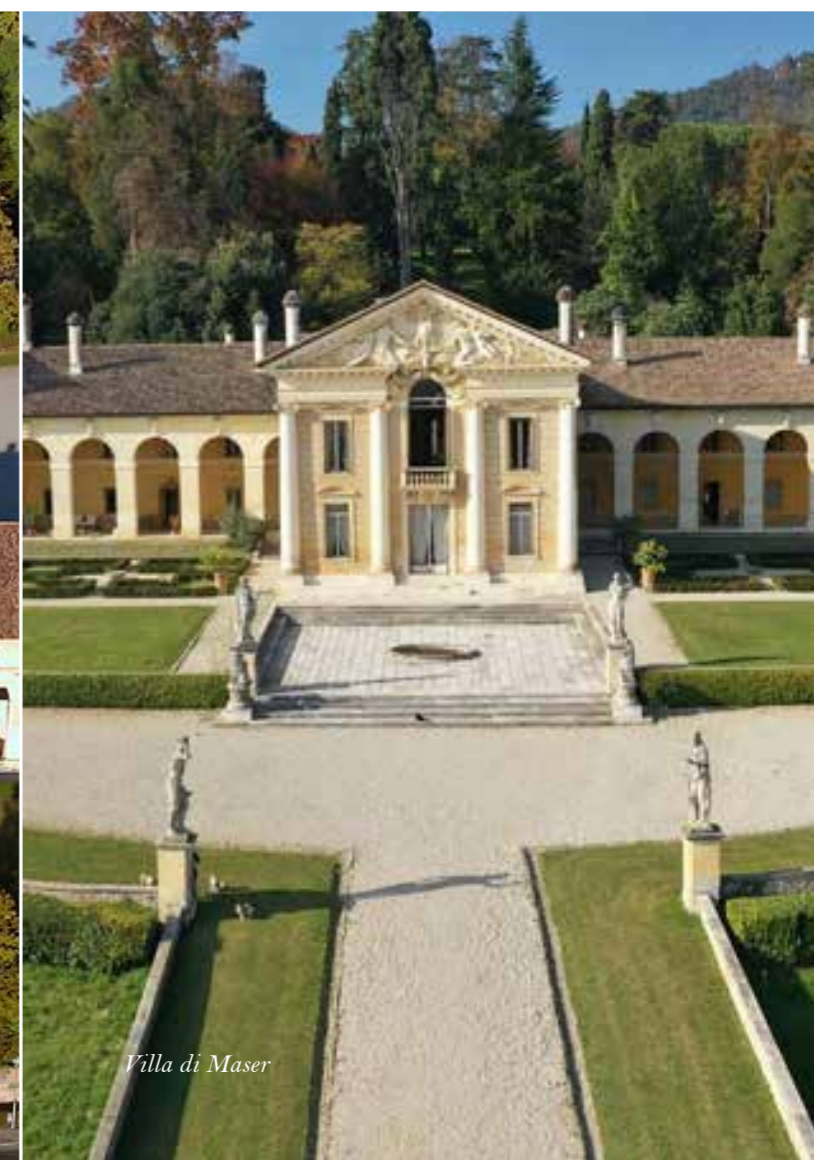
Villa di Maser