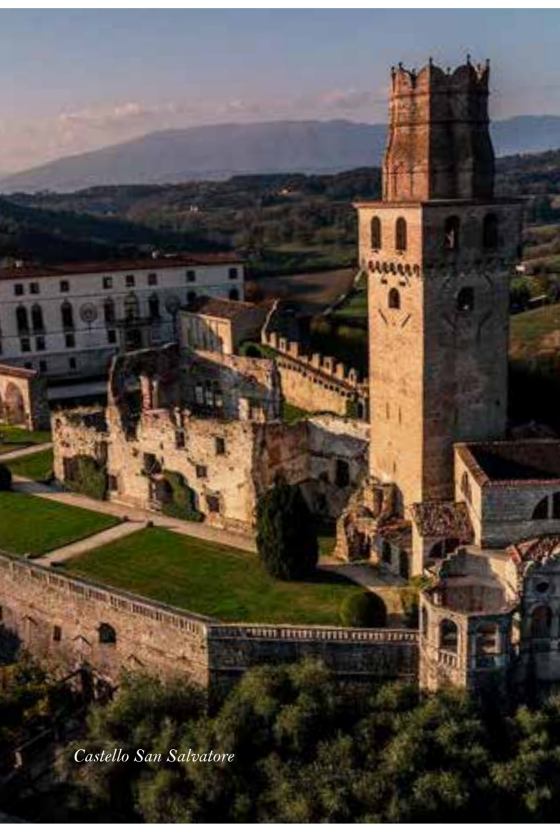
Castello San Salvatore

4 Venerdì 26 maggio dalle ore 15.00 alle ore 19.00 presso Villa di Maser (TV) Andrea Palladio e l'arte di costruire: dal progetto alla realizzazione.