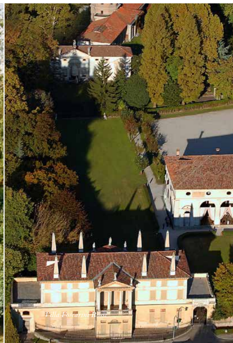
Villa Foscari Rossi