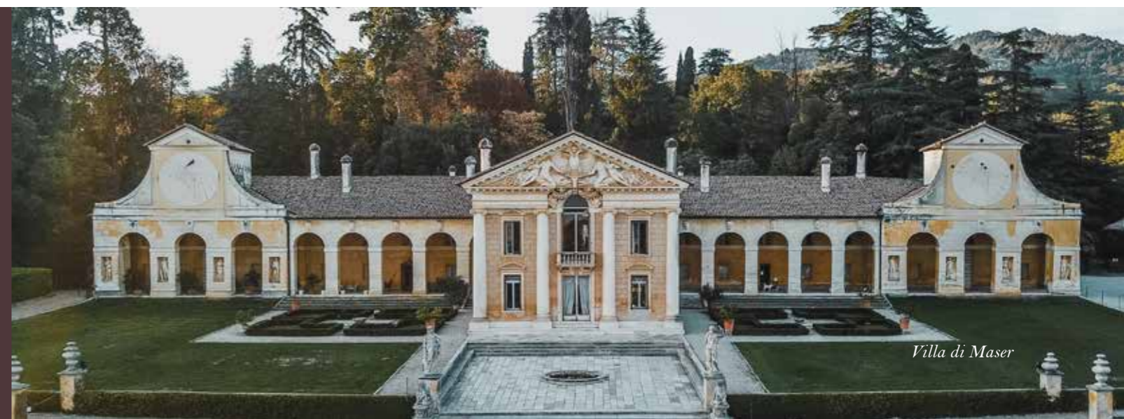
Villa di Maser