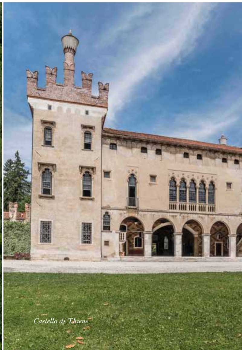
Castello di Thiene