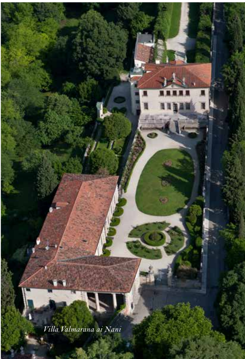
Villa Valmarana ai Nani

La nuova didattica e i cinque sensi: tecniche e strumenti per ri-narrare il patrimonio artistico e culturale