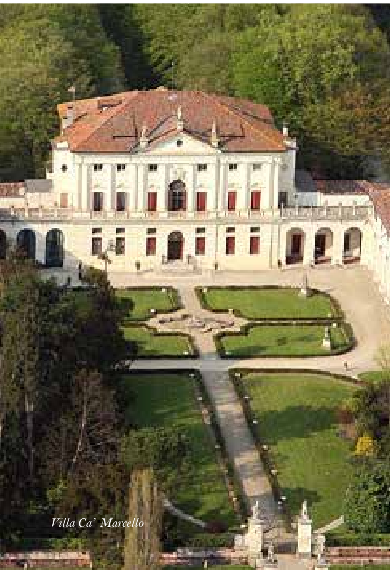
Villa Ca' Marcello

Lettura botanica, storica, geografica e mitologica degli alberi del parco.