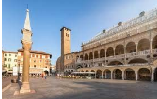
Piazza Erbe e Palazzo Ragione - Padova.