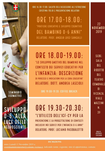
Locandina del primo seminario organizzato dal CPT presso il Teatro Comunale di Vicenza