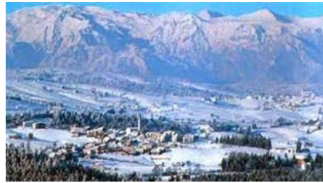
Paesaggio invernale nell'altopiano di Asiago -Vicenza.