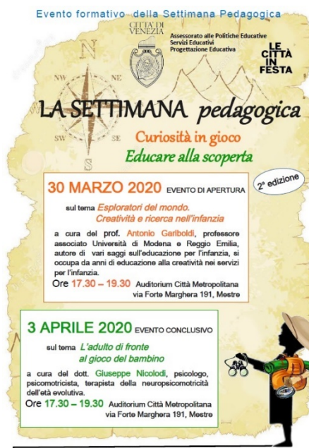
Locandina della settimana pedagogica - CPT di Venezia.