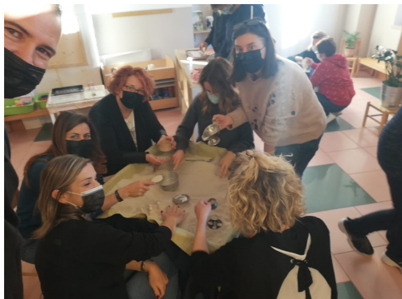
Scuole dell'infanzia dell'IC di Bosco Chiesanuova di Verona in formazione insieme al loro dirigente scolastico.