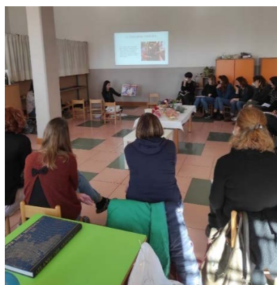
Scuole dell'infanzia dell'IC di Bosco Chiesanuova di Verona in formazione.