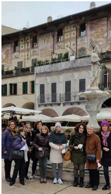
Piazza Erbe - Verona.

"Consultazione sulla Bozza degli Orientamenti «zerotre»" . Tre "tavole rotonde" on line per dialogare e riflettere sul documento. Tempi: 17, 18 e 19 gennaio.