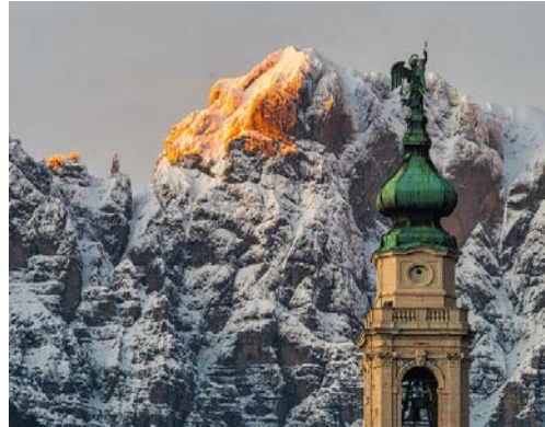
Belluno, particolare del campanile del Duomo- Sullo sfondo "Gusuèla del Vescovà" nota guglia rocciosa situata sul gruppo dello "Schiara"

Gli argomenti per la formazione specifica dei docenti ed educatori non sono ancora stati individuati in modo definitivo. Infatti, nell'ultimo incontro del gruppo viene posta l'attenzione al tema delicato dell'inserimento/ambientamento nelle strutture educative e dell'infanzia e si ipotizza un possibile approfondimento al riguardo.