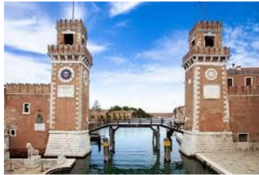
Squarcio di Sestiere Castello di Venezia.