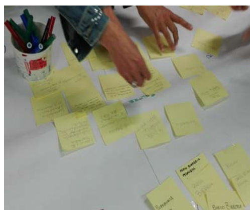
Particolare laboratorio docenti/ genitori dal titolo: "Le mappe di comunità" presso I.C. Pedavena